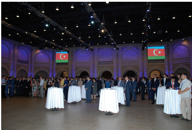
Azərbaycan diplomatiyasının 90 illiyi ilə əlaqədar Bakıda keçirilmiş ziyafət

AZƏRBAYCAN DİPLOMATİYASININ 90 İLLİYİ - 90 TH ANNIVERSARY OF AZERBAIJAN'S DIPLOMACY - 90 ЛЕТИЕ ДИПЛОМАТИИ АЗЕРБАЙДЖАНА