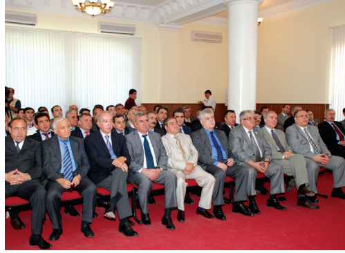
Azərbaycan diplomatiyasının 90 illiyi ilə əlaqədar Gəncəyə səfər etmiş AR-in Diplomatik Nümayəndəliklərinin başçılarının iştirakı ilə keçirilmiş iclas