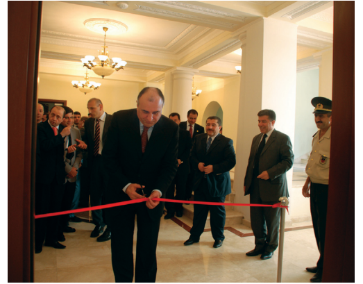
Azərbaycan diplomatiyasının 90 illiyi ilə əlaqədar AR-in Xarici İşlər Nazirliyinin muzeyinin açılışı