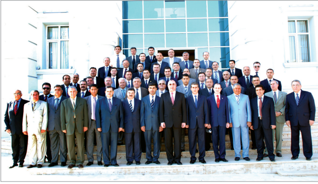
Azərbaycan diplomatiyasının 90 illiyi ilə əlaqədar Naxçıvan şəhərinə səfər etmiş AR-in Diplomatik Nümayəndəliklərinin başçıları ilə Naxçıvan Xarici İşlər Nazirliyinin binası qarşısında birgə foto şəkil