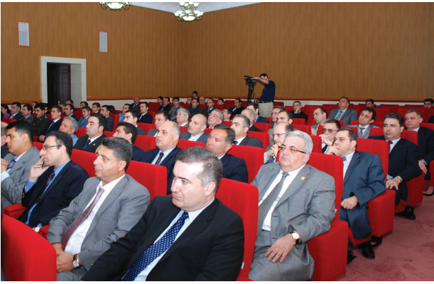
Azərbaycan diplomatiyasının 90 illiyi ilə əlaqədar Naxçıvana səfər etmiş AR-in Diplomatik Nümayəndəliklərinin başçılarının iştirakı ilə keçirilmiş iclas