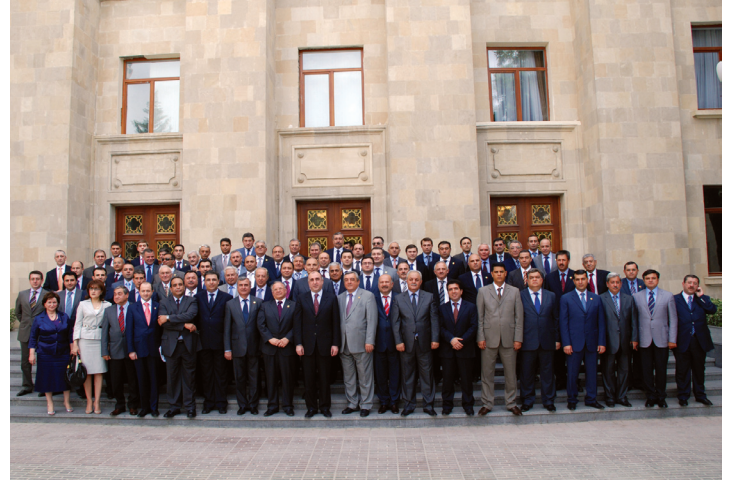
Azərbaycan diplomatiyasının 90 illiyi ilə əlaqədar Azərbaycan Respublikasının diplomatik nümayəndəliklərinin başçıları ilə AR XİN-nin binası qarşısında birgə foto şəkil