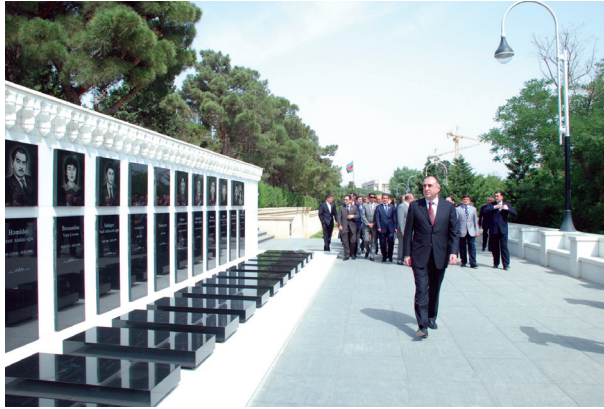
Azərbaycan diplomatiyasının 90 illiyi ilə əlaqədar AR-in Xarici İşlər Nazirliyinin nümayəndə heyətinin Şəhidlər Xiyabanını ziyarəti

AZƏRBAYCAN DİPLOMATİYASININ 90 İLLİYİ - 90 TH ANNIVERSARY OF AZERBAIJAN'S DIPLOMACY - 90 ЛЕТИЕ ДИПЛОМАТИИ АЗЕРБАЙДЖАНА