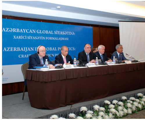
Azərbaycan diplomatiyasının 90 illiyi ilə əlaqədar "Azərbaycan Qlobal Siyasətində Xarici Siyasətin Formalaşması" adlı Bakıda keçirilmiş beynəlxalq konfrans