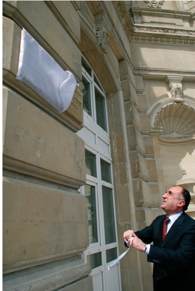
1918-1920-ci illərdə Azərbaycan Xalq Cümhuriyyətinin Xarici İşlər Nazirliyinin yerləşdiyi binada xatirə lövhəsinin açılışı